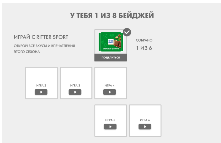
Рис. 2 раздел «Твои награды» в личном кабинете Участника Сайта.

2.1.1.1. Приобретенные Участником уникальные бейджи за прохождение игр на Сайте и игр партнеров Акции отображаются в разделе «Твои награды» в Личном кабинете Участника.